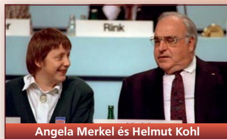
Angela Merkel és Helmut Kohl

Több pénzügyi botrány és egy elsőprő választási veszteség után Kohl át kellett adja a hatalmat ambiciózus utódjának, Angelá Merkelnek, akit már egy ideje arra képzett ki, hogy ő is a kartell politikai bábja legyen.